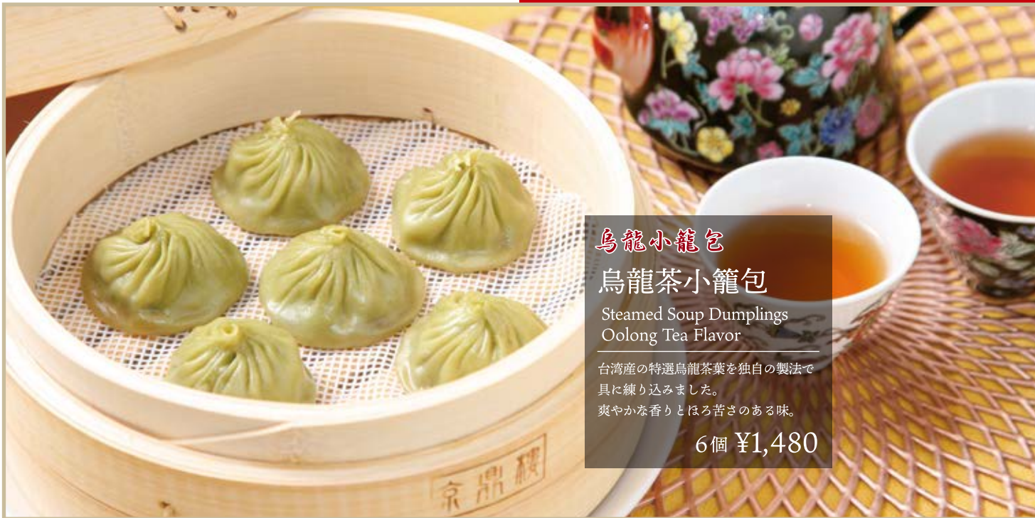
烏龍小籠包 烏龍茶小籠包 Steamed Soup Dumplings Oolong Tea Flavor 台湾産の特選烏龍茶葉を独自の製法で 具に練り込みました。 爽やかな香りとほろ苦さのある味。 6個 ¥1,480