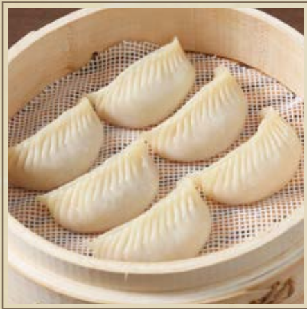
蝦仁蒸餃 海老蒸し餃子 Steamed Dumplings with Shrimp