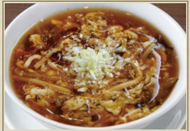
酸辣湯 サンラータン Hot and Sour Soup