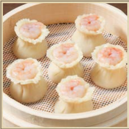
蝦仁燒売 海老燒売 Shumai with Shrimp