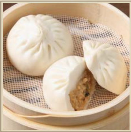
榨菜肉包 ザーサイ肉まん Steamed Pork Buns with Szechwan Pickles