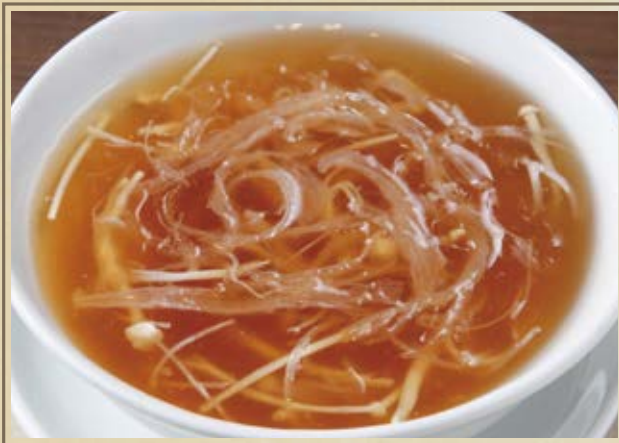
魚翅湯 フカヒレスープ Shark Fin Soup