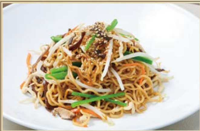
上海炒麵 上海風焼きそば Fried Noodle Shanghai Style ¥1,400