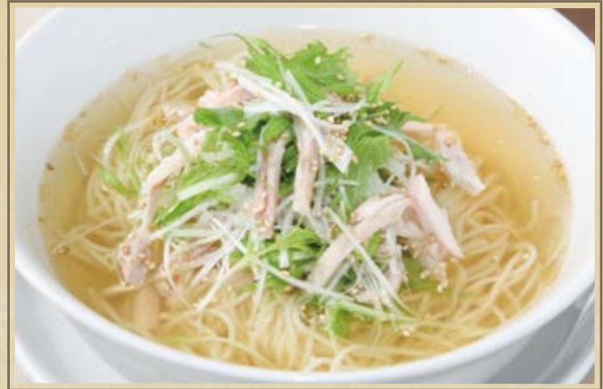
香葱湯麵 鶏そば Boiled Chicken Noodle ¥1,380 小椀 ¥950