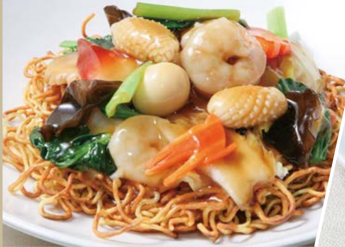
海鮮五目炒麵 海鮮入り五目焼きそば Fried Noodle with Special Seafood and Vegetable ¥1,980