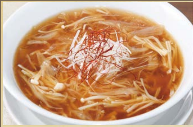
魚翅湯麵 フカヒレ入りスープ麵 Shark Fin Noodle ¥2,100 小椀 ¥1,500