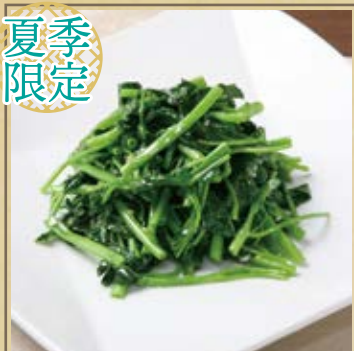
空芯菜のガーリック炒め