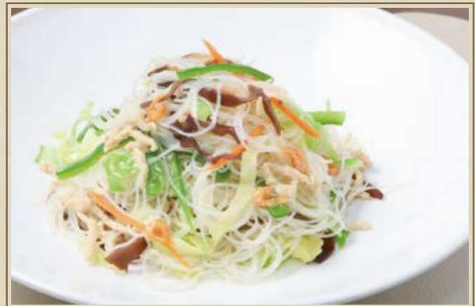
炒米粉 台湾焼きビーフン Taiwanese Fried Rice Noodle ¥1,400