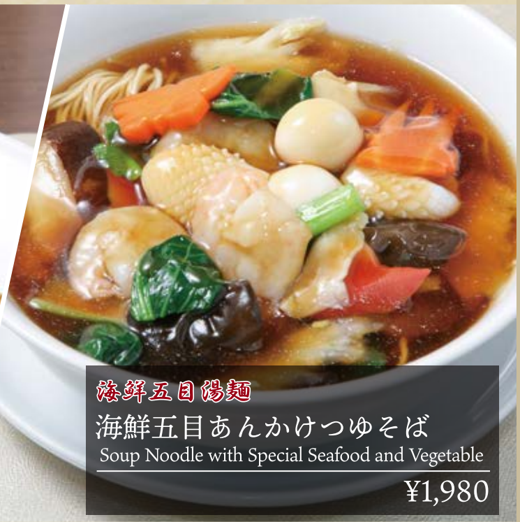
海鮮五目湯麵 海鮮五目あんかけつゆそば Soup Noodle with Special Seafood and Vegetable ¥1,980