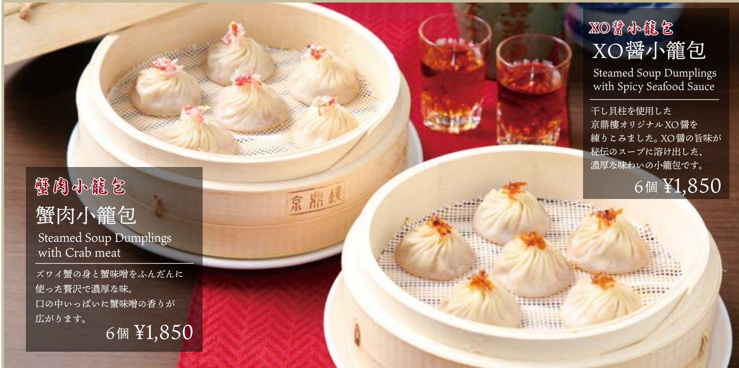
蟹肉小籠包 蟹肉小籠包 Steamed Soup Dumplings with Crab meat ズワイ蟹の身と蟹味噌をふんだんに 使った贅沢で濃厚な味。 口の中いっぱい蟹味噌の香りが 広がります。 6個 ¥1,850