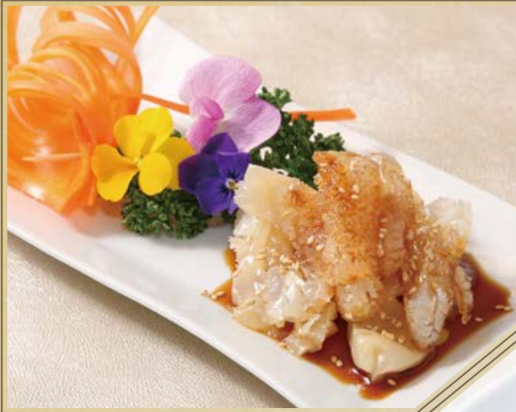
黒酢海蜇頭 クラゲの冷菜