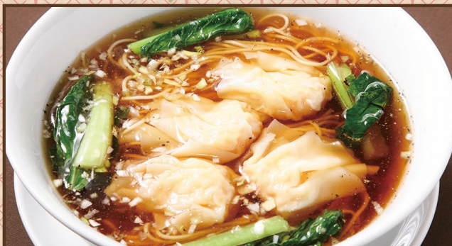
香港海老ワンタン麺 (醤油)