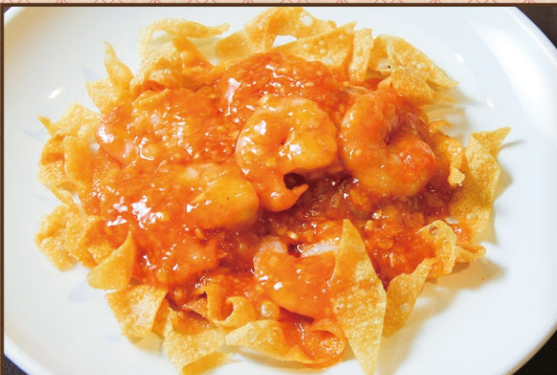
海老のチリソース