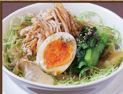
ジューローハン 鶏肉飯