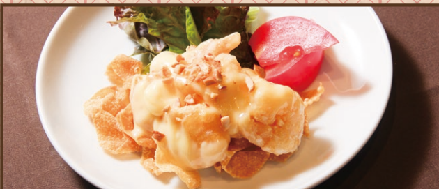
海老の台湾マヨネーズ和え