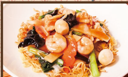
五目餡かけ焼きそば