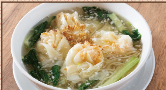
香港海老ワンタン麺 (塩)