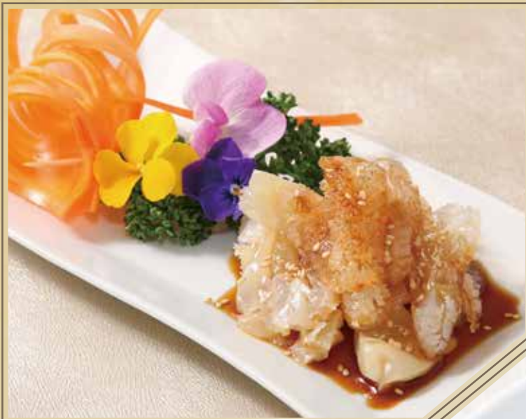
黒酢海蜇頭 クラゲの冷菜