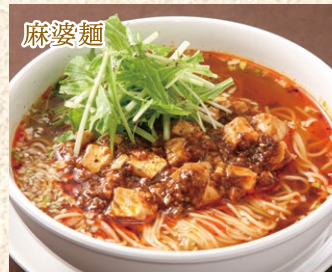
麻婆麺 Mapo Tofu Noodle