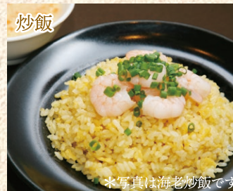
本日の炒飯 (スープ付) Today's Fried Rice