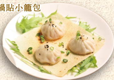
羽根つき焼小籠包 Fried Xiao Long Bao