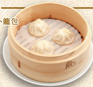
蒸し小籠包 Steamed Xiao Long Bao