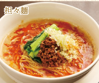
担々麺 Tan-Tan Noodle