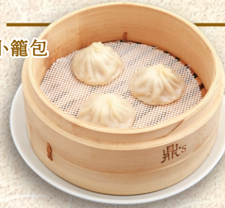
蒸し小籠包 Steamed Xiao Long Bao