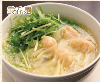
香港海老ワンタン麺 Won Ton Noodle