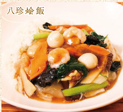
八品目餡かけご飯(スープ付) Rice with Special Seafoods and Vegetable