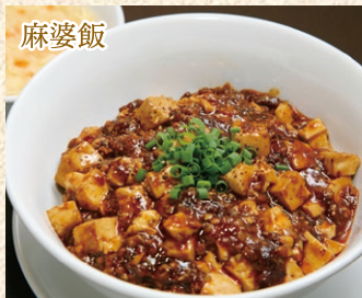
麻婆飯 (スープ付) Mapo Tofu Rice