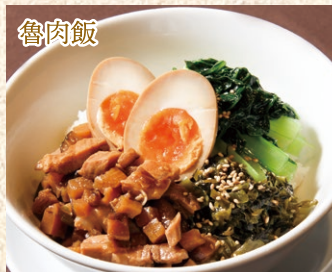
ルーロー飯 (スープ付) Minced Pork Rice