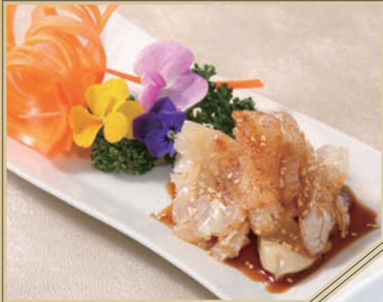
黒酢海蜇頭 クラゲの冷菜