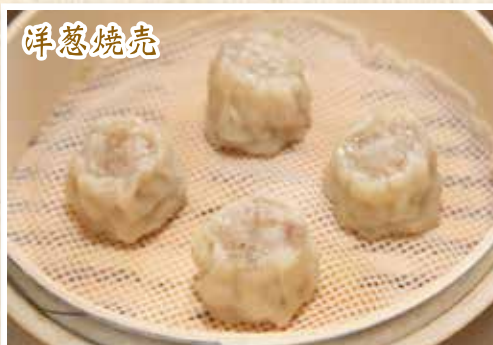
香港ひとくち焼売 (4個) ¥490