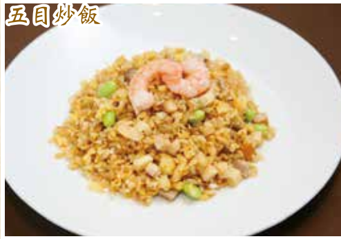
五目炒飯 ¥1,000 (小碗) ¥680