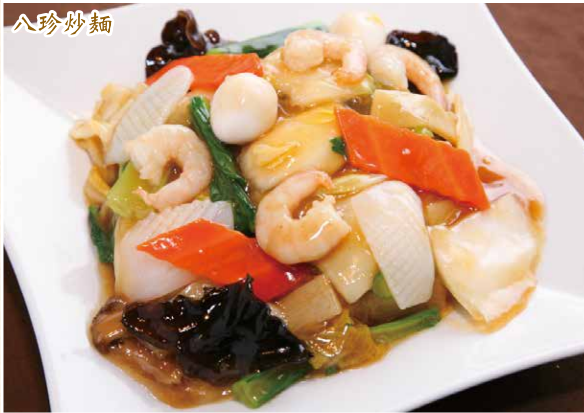
八品目 餡かけ焼きそば ¥1,280

Fried noodle with special seafoods and vegetable