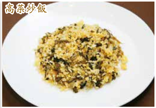
高菜炒飯 ¥1,000 (小碗) ¥680