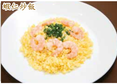
海老炒飯 ¥1,000 (小碗) ¥680