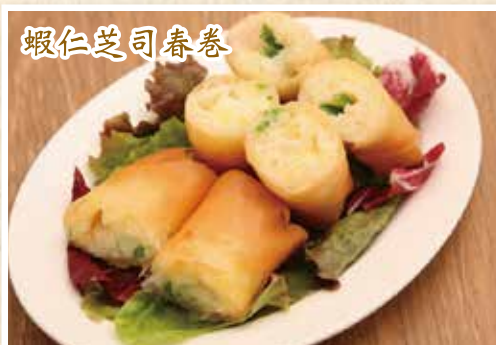
海老チーズ春巻き (2本) ¥580