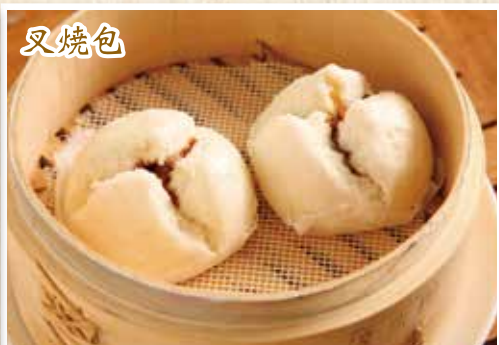
チャーシュー饅頭 (2個)