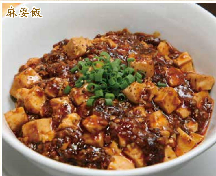
麻婆飯 ¥980 (小碗) ¥650

Bean curd with minced pork chilli sauce on rice