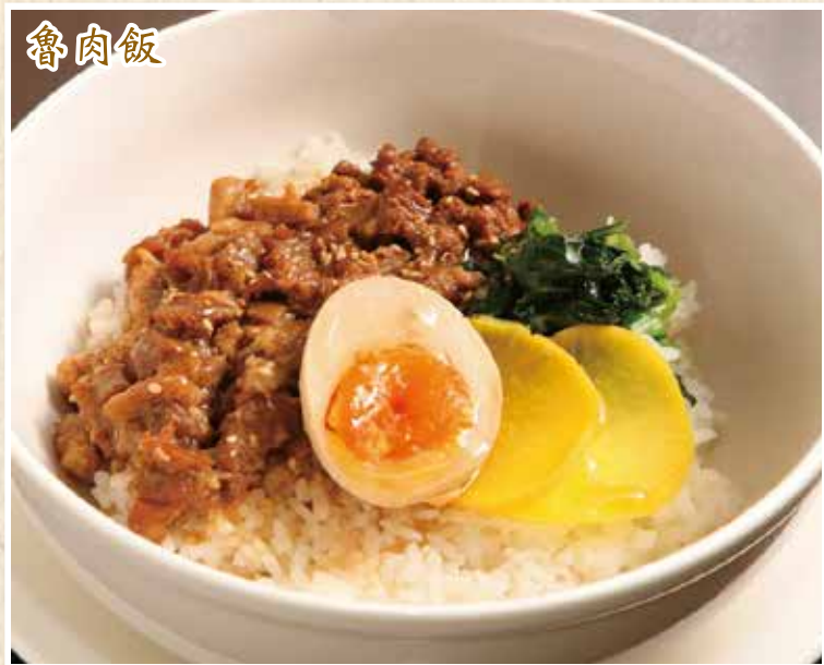
ルーロー飯 ¥980 (小碗) ¥650