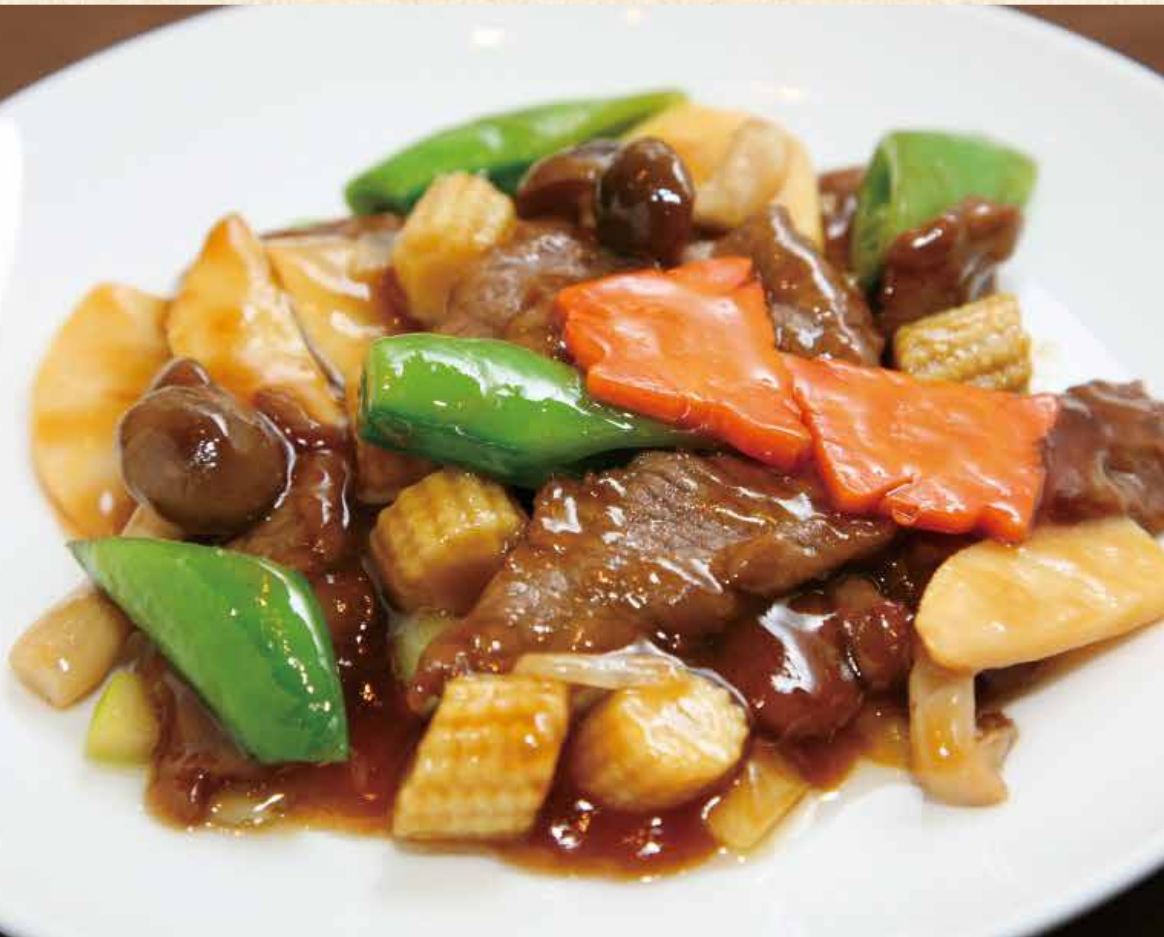
蠔油牛肉 牛肉の オイスター炒め