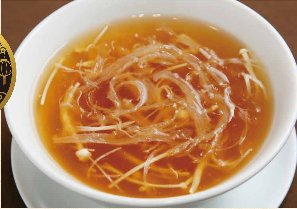
魚翅湯 フカヒレスープ