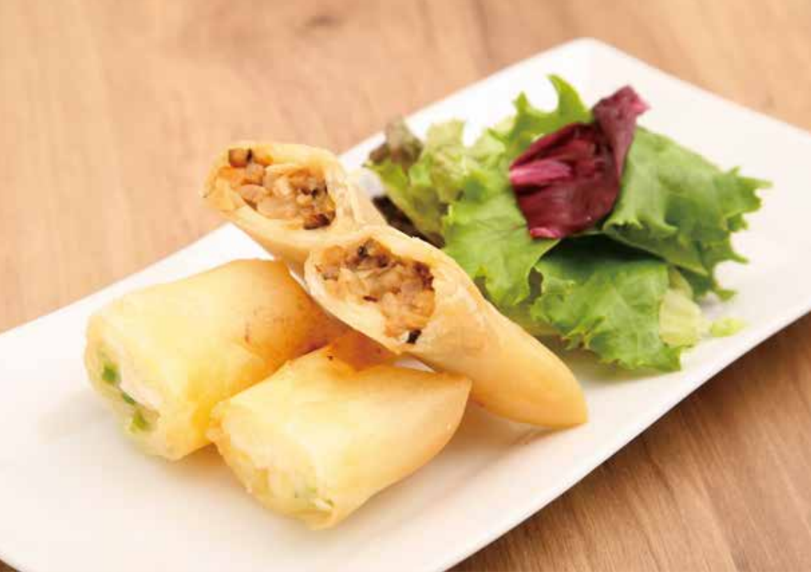
二種春巻 春巻 二種盛 (竹の子春巻・海老チーズ春巻)