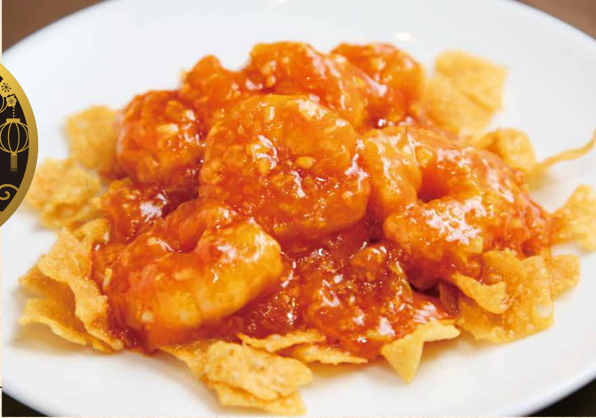
乾焼蝦仁 海老のチリソース