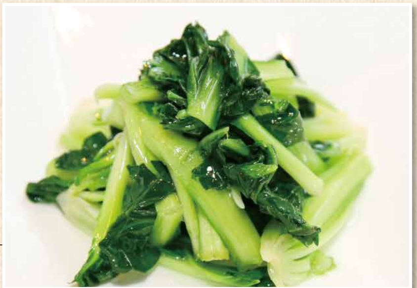
炒青菜 青菜のガーリック炒め