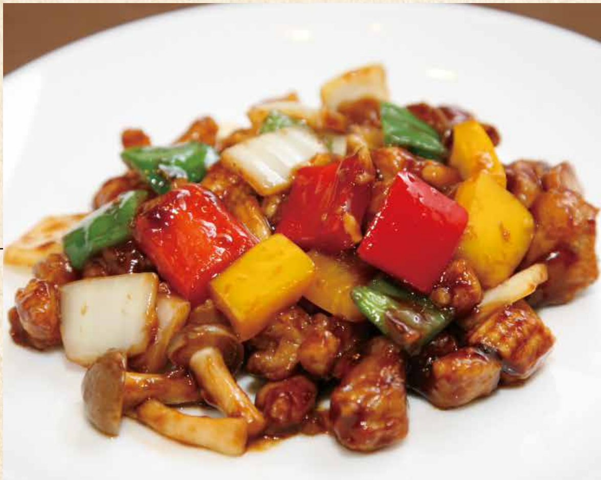
醬爆鶏丁 鶏肉の 甘味噌炒め 950円