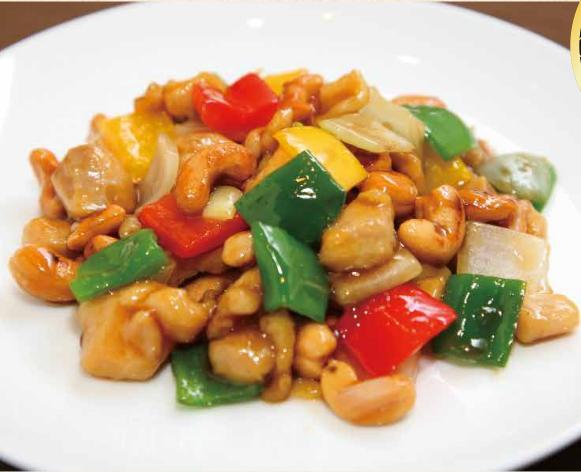
腰果鶏丁 鶏肉の カシューナッツ炒め 950円