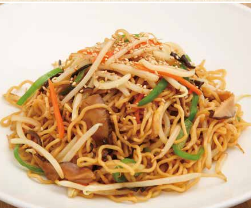
上海焼麵 上海焼きそば