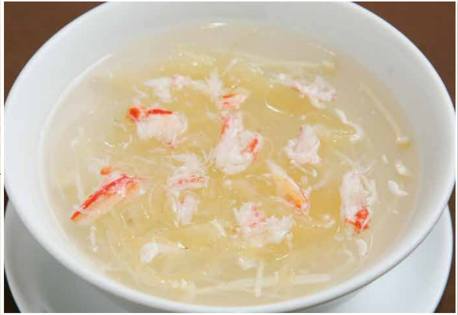
蟹肉魚翅湯 カニと卵白入りフカヒレスープ