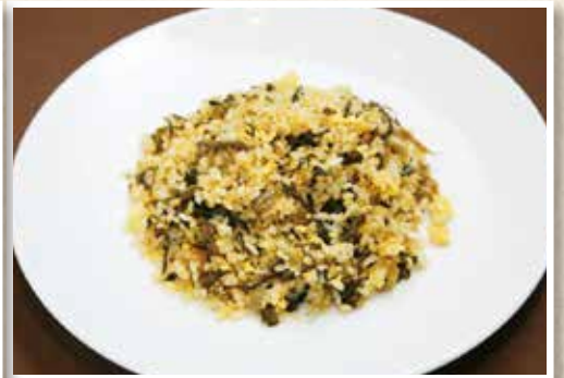
高菜炒飯 高菜炒飯