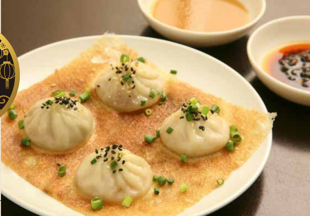
鍋貼小籠包 羽根つき焼小籠包