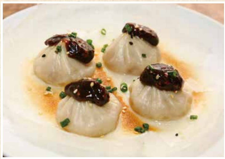
甜醬小籠包 甘味噌だれの羽根つき焼小籠包