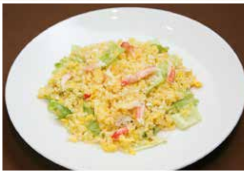
蟹肉炒飯 カニとレタスの炒飯