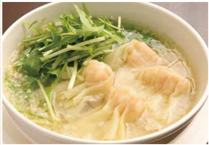
雲呑麵 ワンタン入りスープ麵