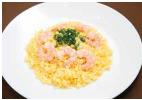
蝦仁炒飯 海老炒飯