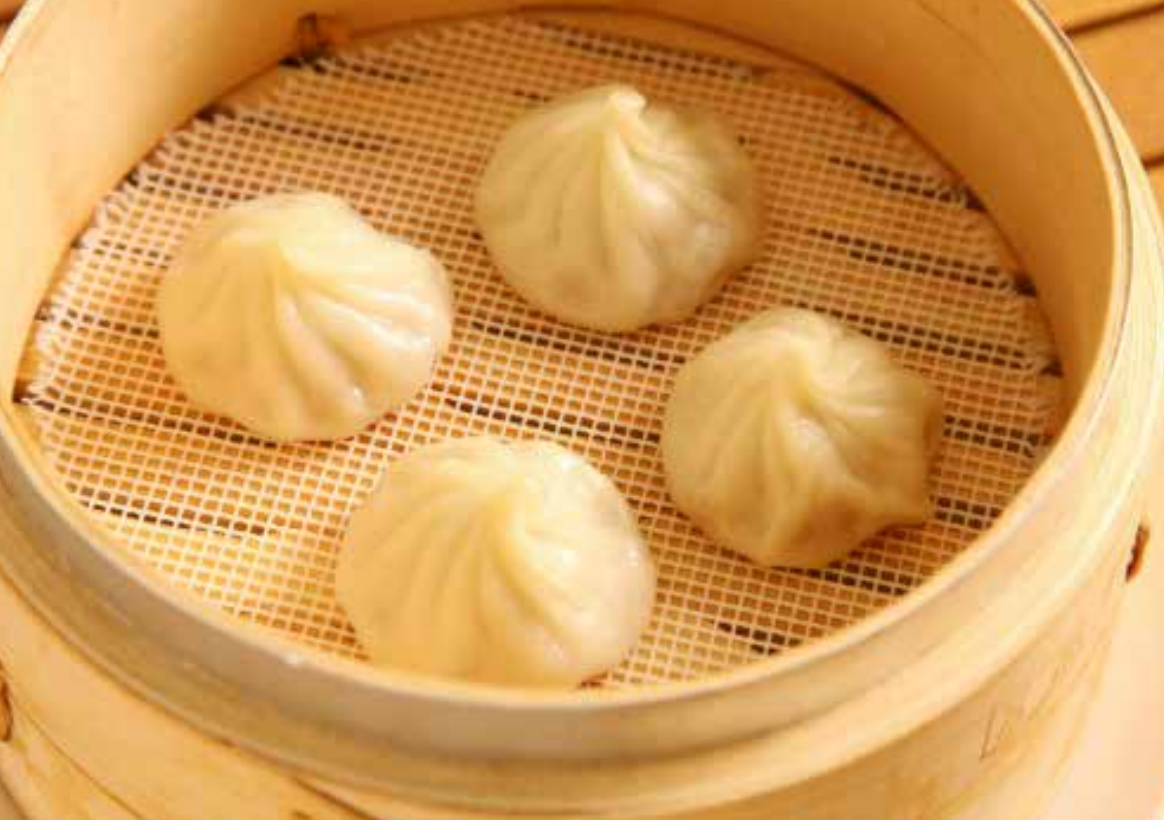
蒸小籠包 蒸し小籠包