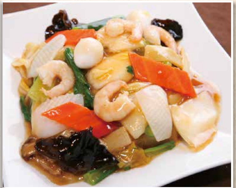
八珍炒麵 八品目餡かけ焼きそば