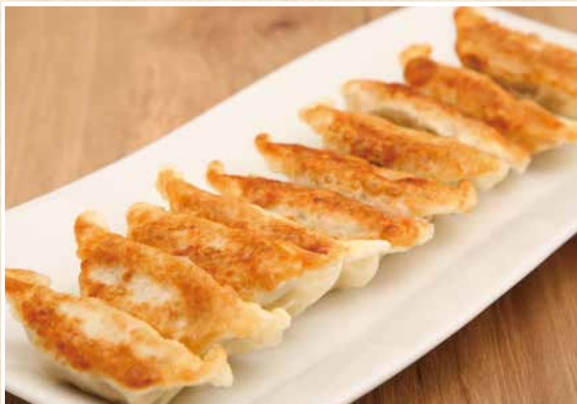
鶏肉餃子 鶏ささみひとくち餃子 (10個)