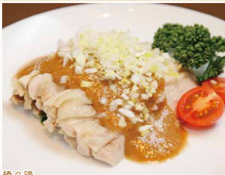
棒々鶏 バンバンジー