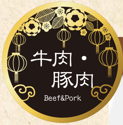
青椒肉絲 チンジャオロース