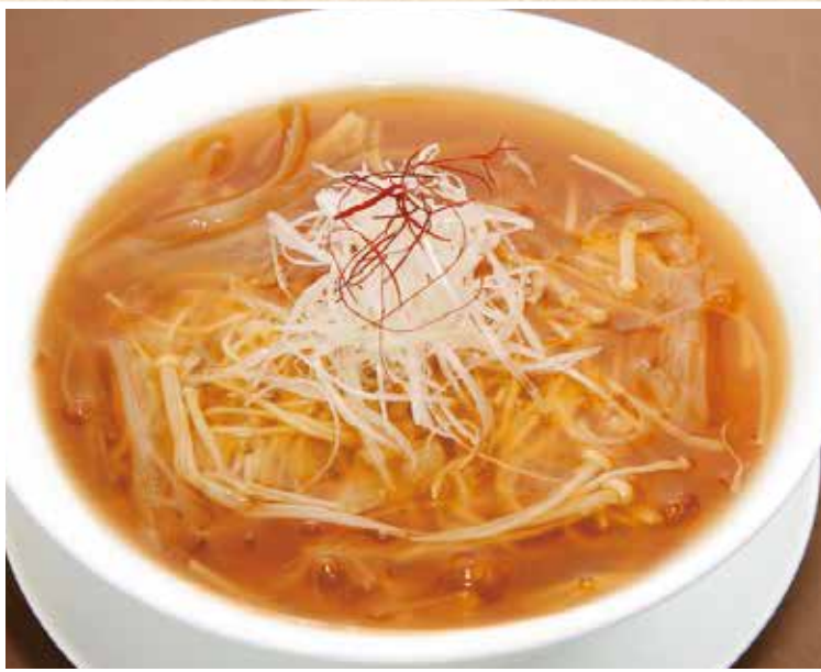
魚翅湯麵 フカヒレ入りスープ麵