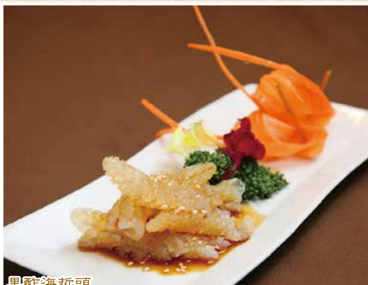
黒酢海哲頭 くらげ