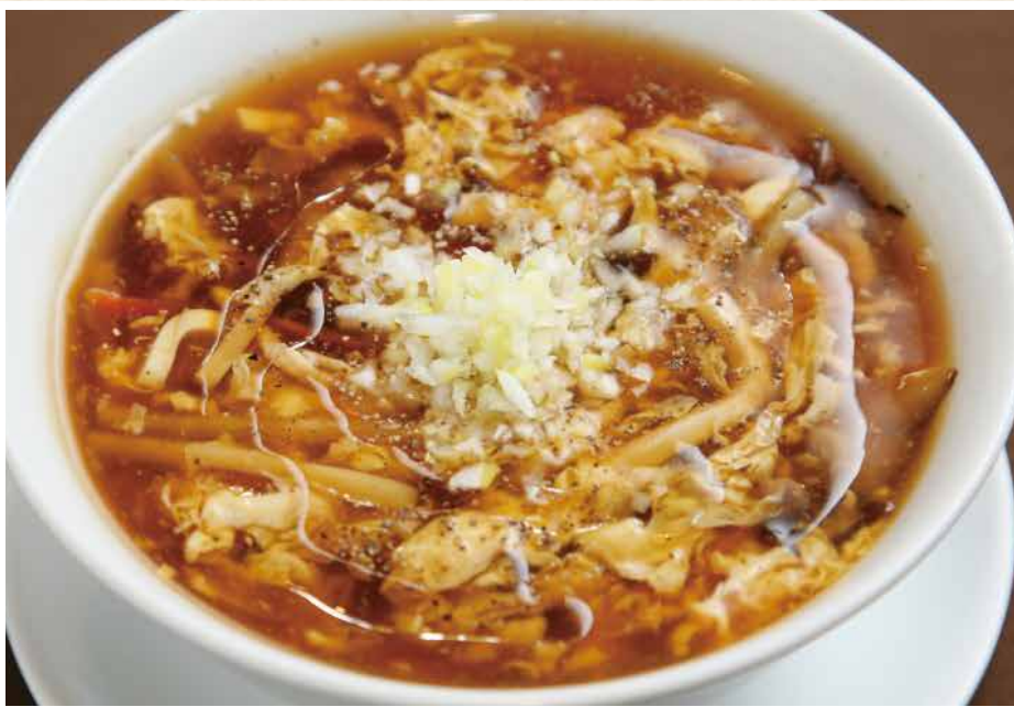
酸辣湯 サンラータン