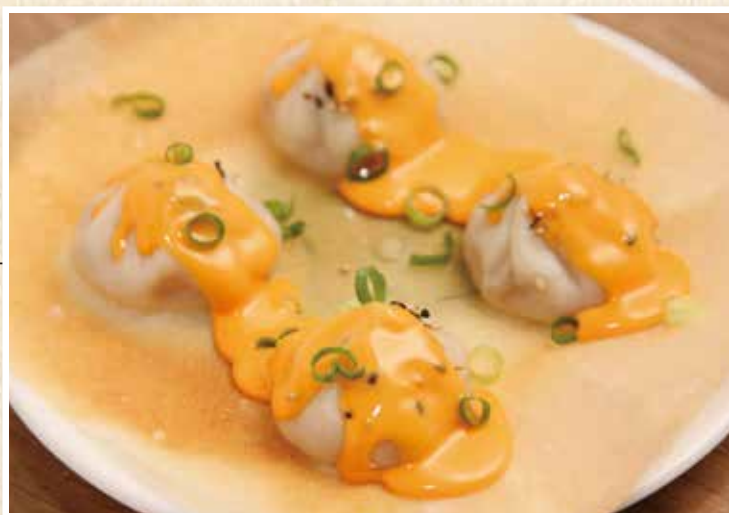
水小籠包 水小籠包