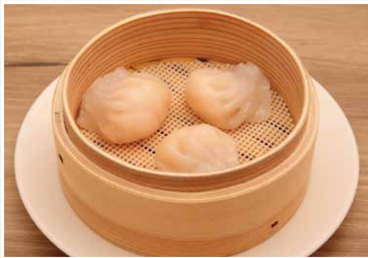
蝦餃子 海老水晶ギョウザ (3個)