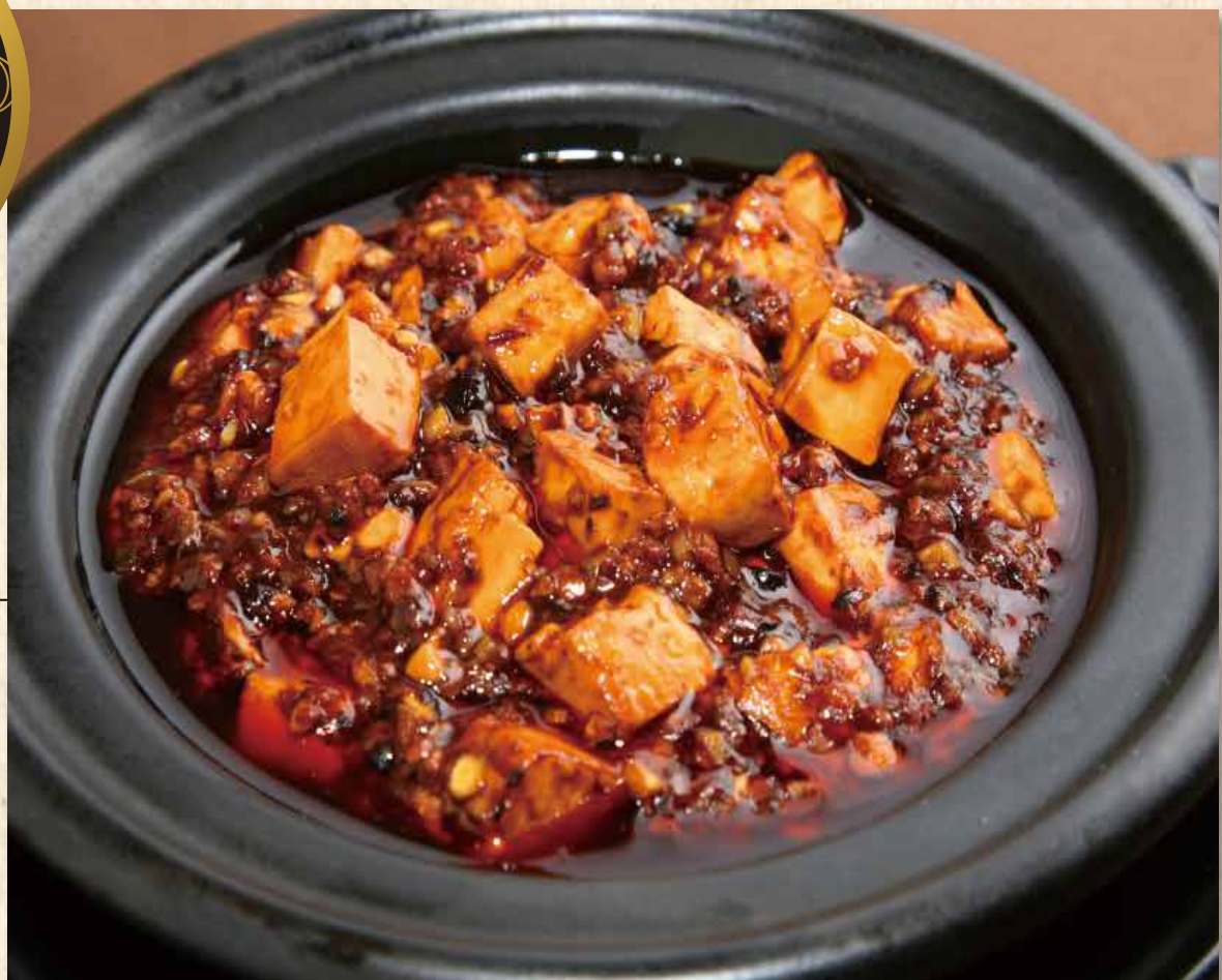
麻婆豆腐 麻婆豆腐