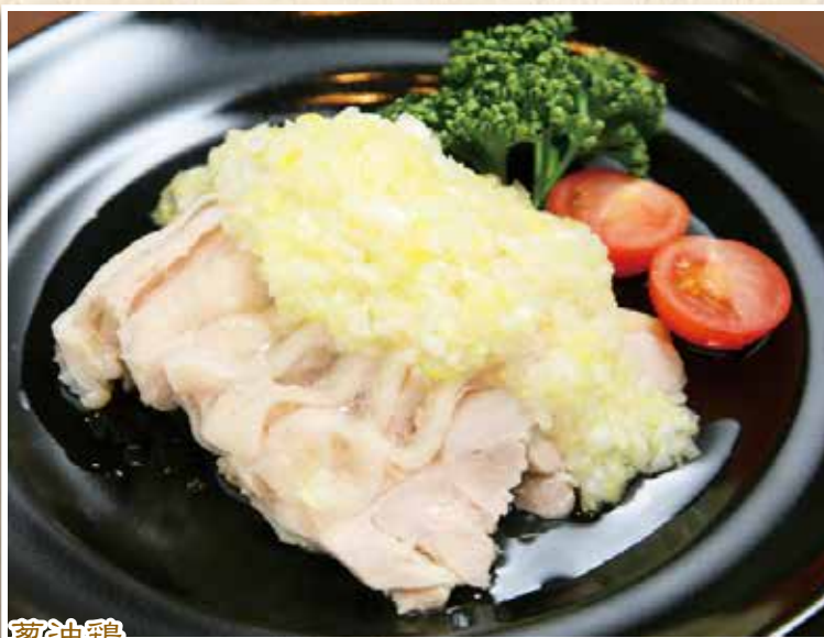
葱油鶏 蒸し鶏の冷菜