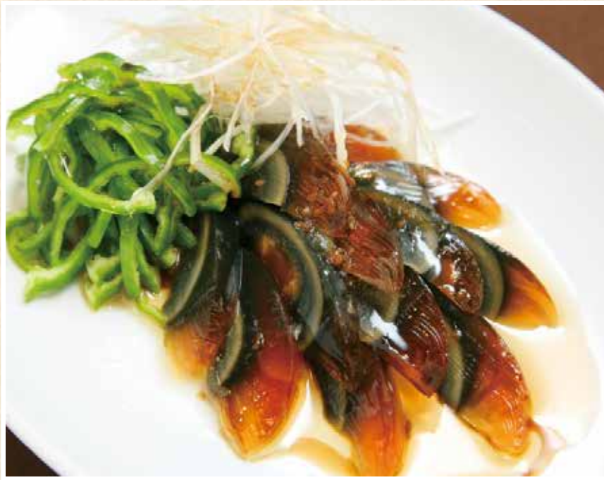
青椒皮蛋 ピータン