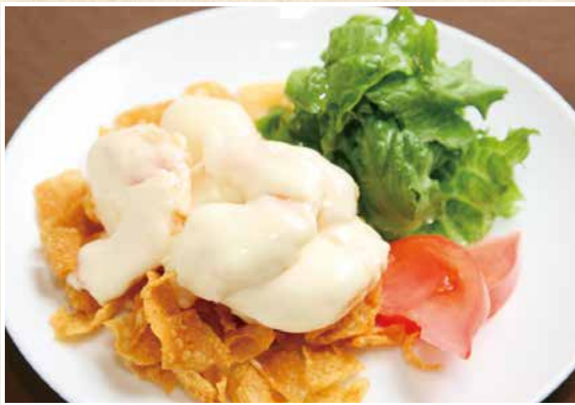
沙律蝦仁 海老の台湾風マヨネーズ和え