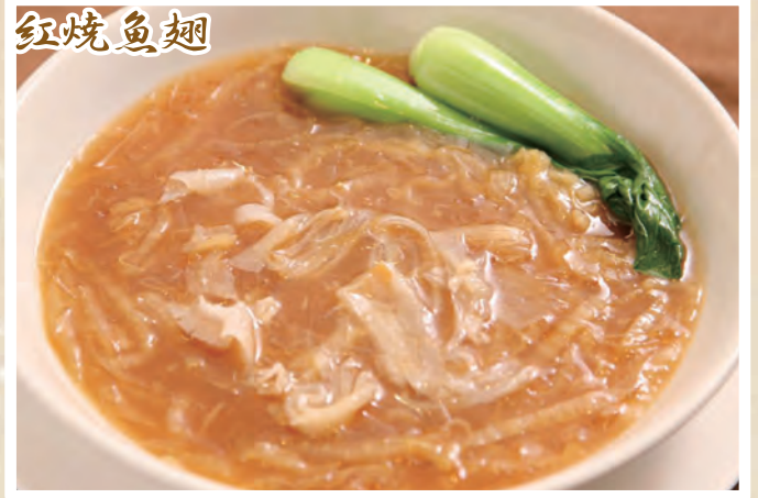
白菜とフカヒレの醤油煮込み