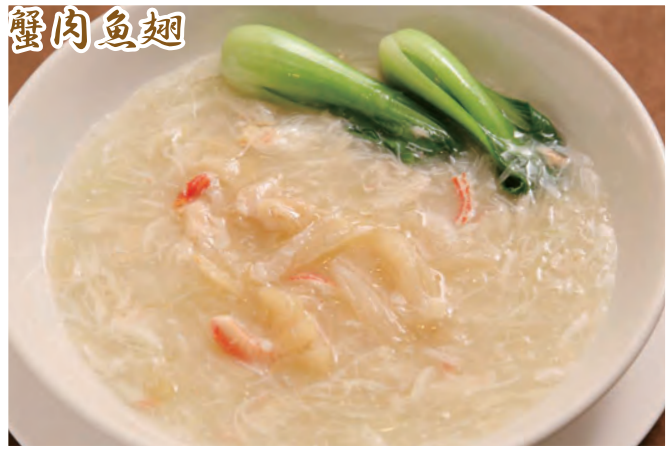
ズワイ蟹とフカヒレの旨煮